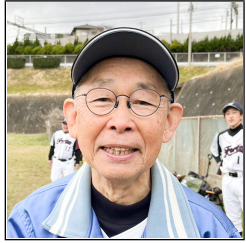
逆転サヨナラを呼び込んだ四球でした(丸木)