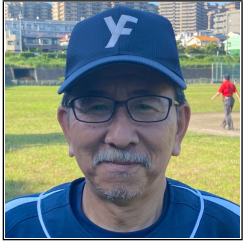
4回無四球完封 (早川)