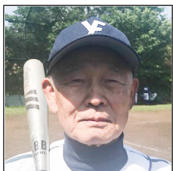
1打で3点あげました (西岸)

初回浜友高橋季が初球死球即二、三盗、後藤四球二盗を決め、その後満塁で西岸走者一掃の3点適時打で計5点を先制する。その後も出ては盗塁機会に走りまくって適時打のみならず、内野ゴロ、犠飛と様々な形で加点し、毎回得点を挙げた。あくまで憶測の域を出ないが、二盗までなら防げた失点が半分近くあるように思えた。一方浜友先発後藤は大量得点に守られて開幕戦以来の今季2勝目を挙げた。また7盗塁の荒稼ぎでこの部門の単独トップに立った。初回到3点適時打の西岸がMVPを獲得した。(湘南:石川伸)