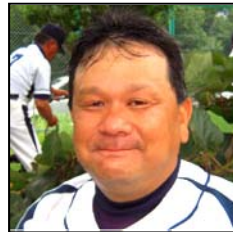
やっとこ本来の当たりが戻ってきました