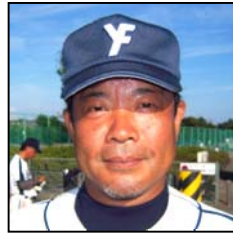
15cmだけのHRですけど、まあいいじゃん(笑)