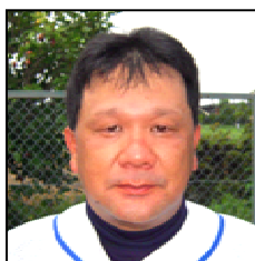
あっりゃ～！ また打ったのね～！ HR 1位タイです