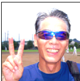
文字通り投打に大活躍。紫のサングラスが輝いております。