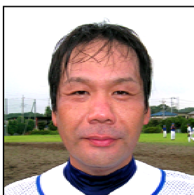
受賞理由はなんでしたっけねえ？聞いたのですが忘れてしまいました