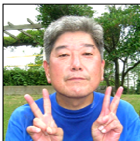
打っちゃいました! サヨナラヒット 参りました。