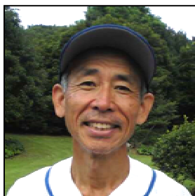
2塁打3打点と久々の大当りでした。