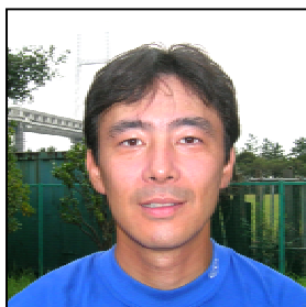
先週は守備で、今週は打撃でと大活躍です。HRも2本差でトップ。