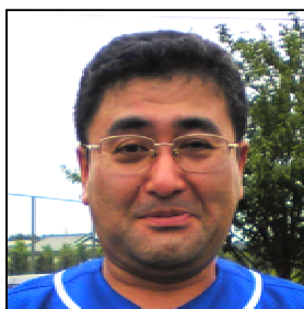
薫chan打ったね~! 2打点をあげる2塁打、おみごと!!