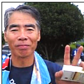
3回を1安打・1四球だけに抑えました ナイスピッチング